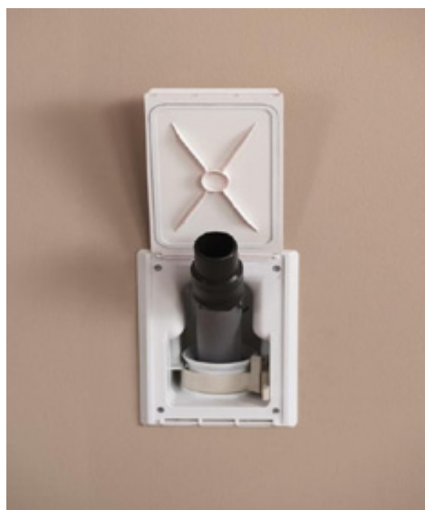
Hide a Hose det ultimata systemet för slanghantering