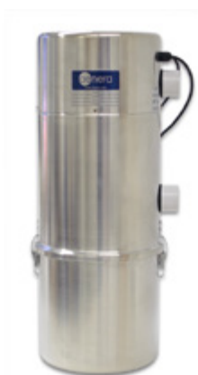
Power Vac 2100

Som sugkälla till Hide a Hose rekommenderar vi våra centralenheter modell Power Vac *1800, 2100, C-2400 eller C-3010TS för bästa funktion. ( * Beroende på rör och slanglängder )